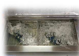
超音波洗浄 (イメージ)